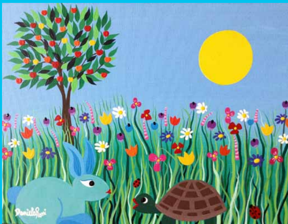
"Il coniglio e la tartaruga", 40 x 50, Acrilico su tela, 2017