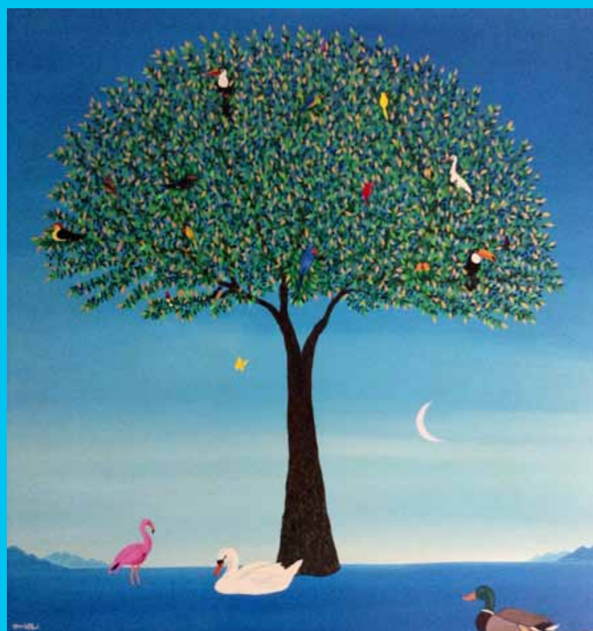
"L'albero della Vita", 100 x 100, Acrilico su tela, 2016