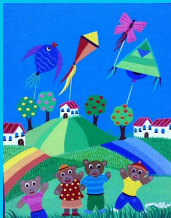
"Il volo degli aquiloni", 40 x 50, Acrilico su tela, 2017