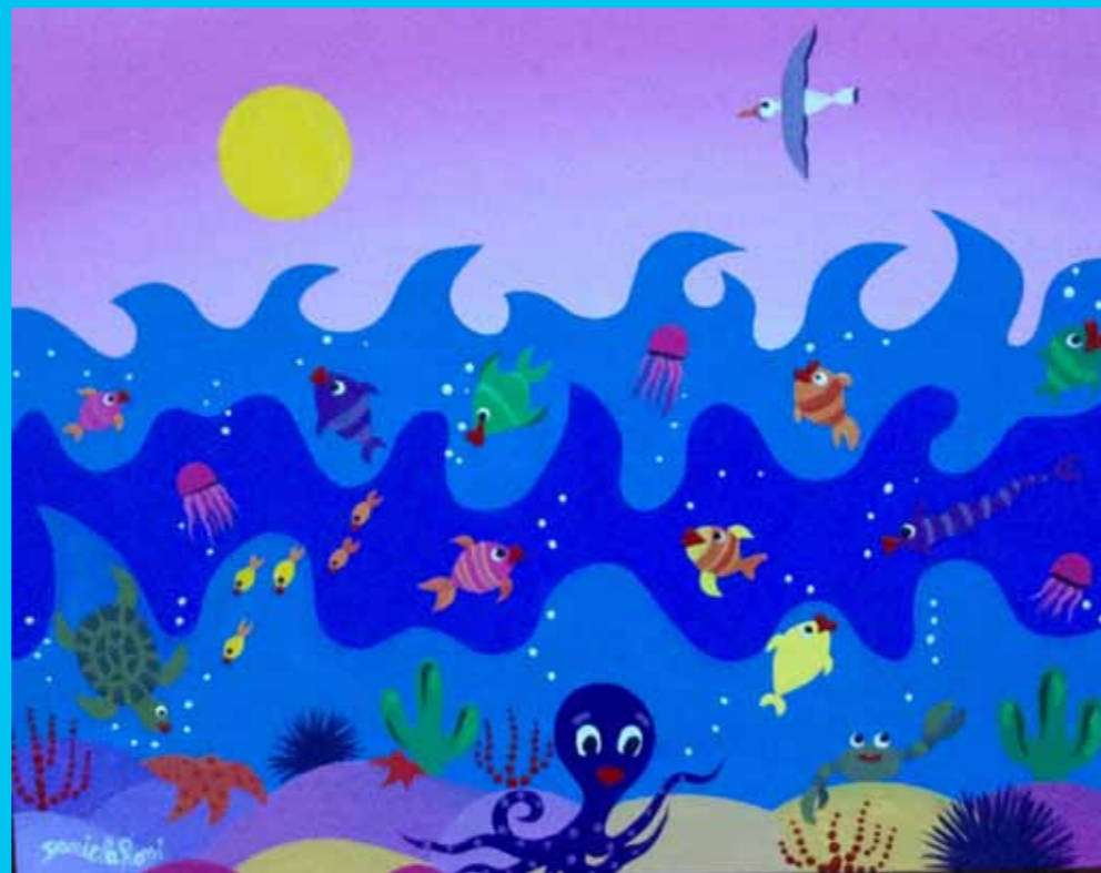
"Vita nel mare", 40x50, Acrilico su tela, 2017